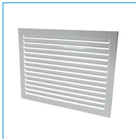
Решетка декоративная VKR(D)

Решетка RAL9016 оклеена защитной пленкой, которую необходимо удалить после монтажа.