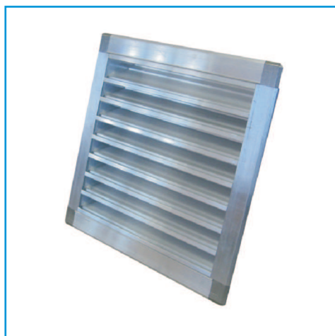
Решетка алюминиевая VKR(A)